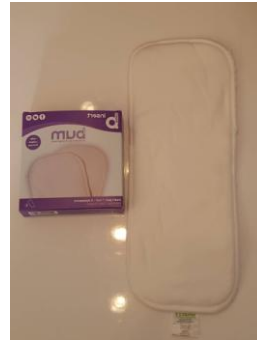
Insert Jour/nuit 5 épaisseurs 3 matières : - coton bio - microfibre - bambou

Régler la taille de la couche en fonction de la morphologie du bébé grâce au pression sur le devant de la couche pour la rétrécir (voir photos ci-dessous).