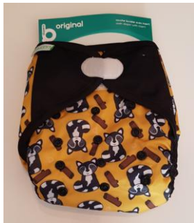
couche TE2 3/15+ KG