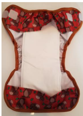
Mettez l'insert dans la couche