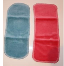
Les boosters en Coton BIO

Tous les produits envoyés dans votre commande ont été lavés et dégrasés avec des produits respectueux de l'environnement.