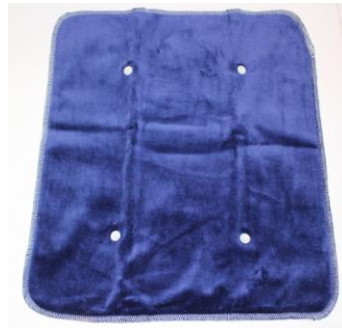
L'insert en coton BIO