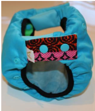
La couche ApiAfrique