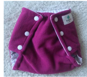
Culotte de protection

Les couches sont douces, elles sont en polaire et ont un effet au sec.